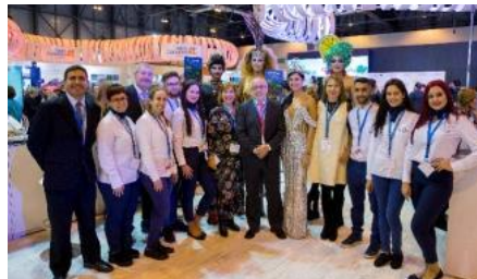
El presidente del Cabildo de Gran Canaria, Antonio Morales (centro) con el personal del Patronato de Turismo desplazado a

Es un nuevo mercado en el que se quiere incidir y en ese sentido el Cabildo ya tiene cerrada una agenda de 36 reuniones en Fitur para crear nuevas líneas de cooperación con los principales agentes del sector y consolidar el potencial del mercado nacional en 2018.